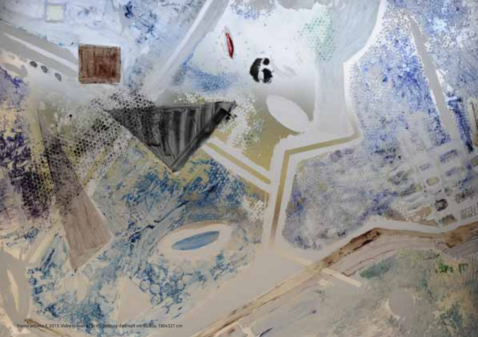
Trama urbana II , 2013. Vidre gravat a l'acid i pintura d'esmalt vitrificada. 180x321 cm