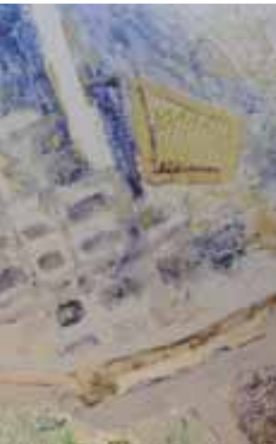
Trama urbana II , 2013. Detall Vidre gravat a l'àcid. 180x321 cm