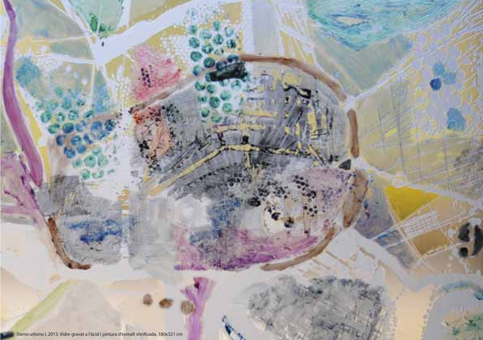
Trama urbana I , 2013. Vidre gravat a l'àcid i pintura d'esmalt vitrificada. 180x321 cm