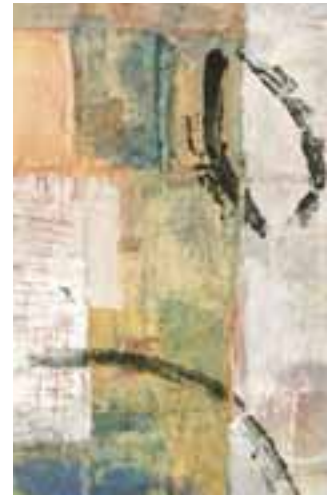
Renéixer com la flor , 2006-2013. Detall. Tècnica mixta en fibra de vidre. 210x137 cm.